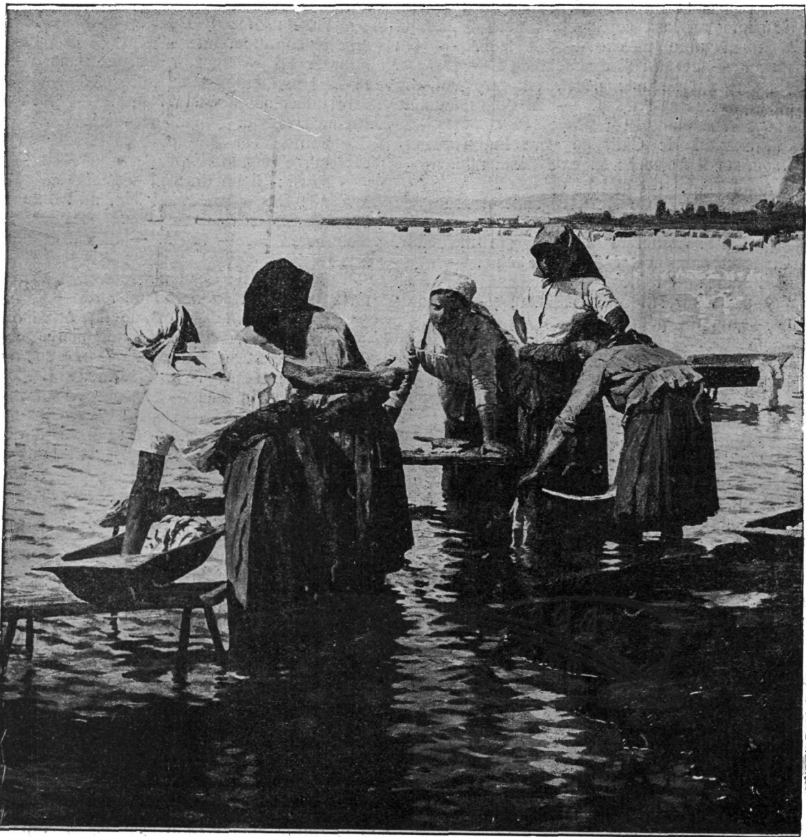
La spălat de rufe.