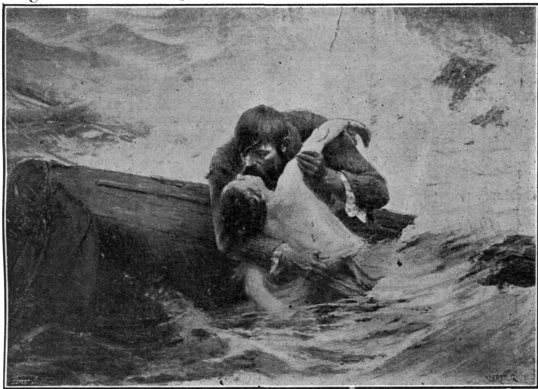
Sărutul din urmă.

Femeile își aninaseră la brâu rochițele dealtcum scurtuțe, lăsând să strălucească în soare genunchii slăbuți și scorțuroși, tălpile desculțe, cu tină uscată pe ele. Fețele lor palide, arămii, moștenite din părinți pătimași, alcoolisți, se înbujuaseră de căldură într'o roșăță bolnavă — ofticoasă. Săpau tăcute, mo-