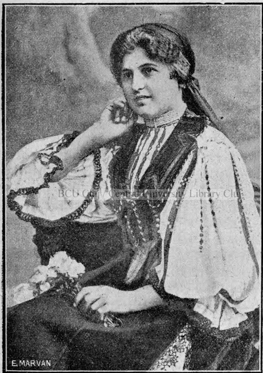
Fată română din Săliște (Sibiu).