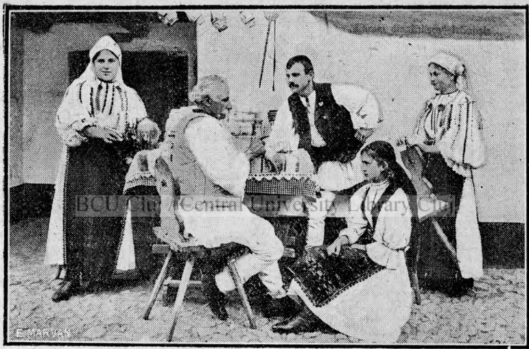
Familie de țărani din Tilișca (Sibiu).