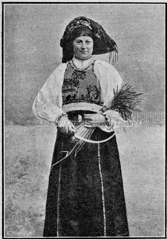
Nevastă română din Porumbacul-de-jos.