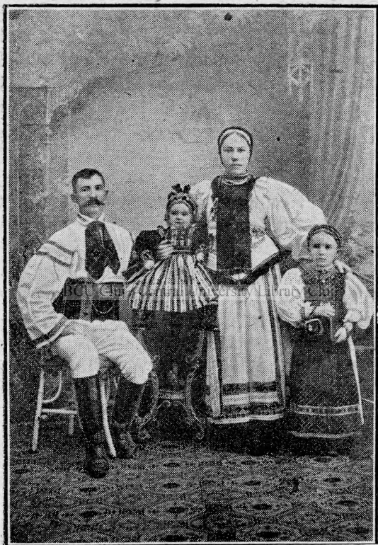
Familie de țărani sași din jurul Bistriței.