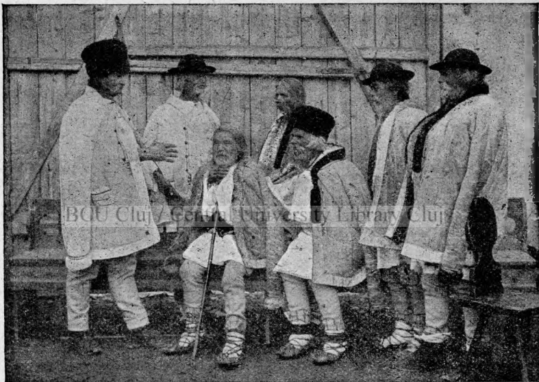
Poenari români din Poiana-Sibiului.