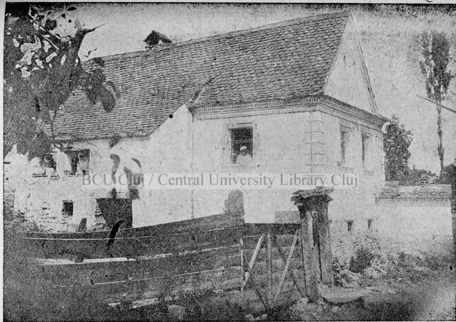
Casa din Fofeldea (jud. Sibiu) în care s'a născut August Treboniu Laurian.