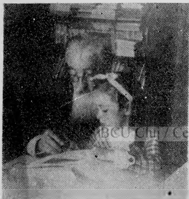
Bunicul își învață nepoțica să scrie...