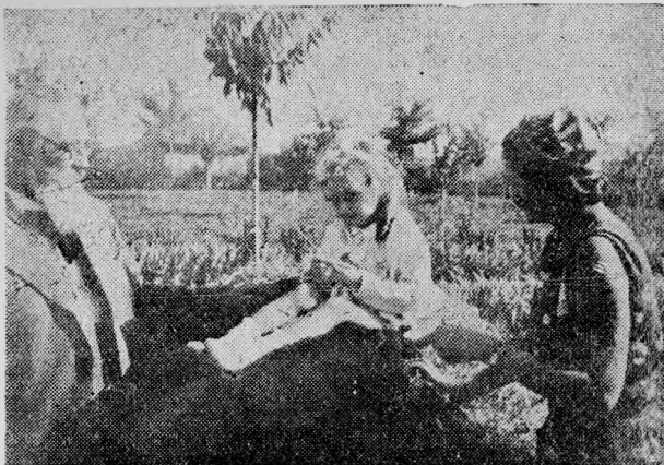
Bunicul și nepoata