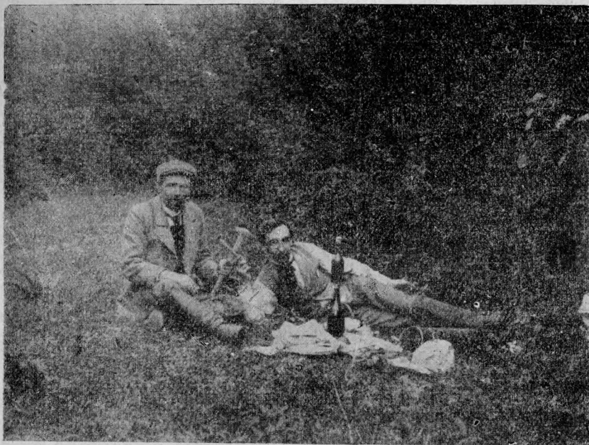
Popas într'o excursie geologică în 1898. (în dreapta, descoperit)