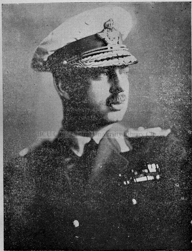
MAJESTATEA SA REGELE CAROL II MARELE STRĂJER