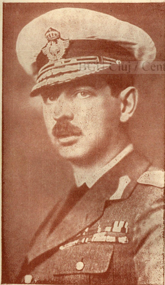
M. S. REGELE CAROL II.