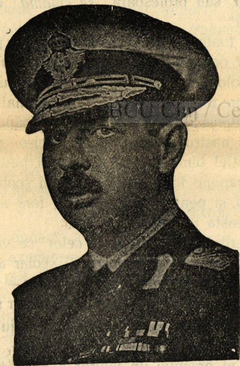
M. S. REGELE CAROL II, Voevodul culturii Române.

„În clipele grele prin care trece Țara, fac cel mai cald apel tuturor fiilor săi, la cea mai sinceră și desinteresată colaborare, pentru dezvoltarea forțelor ei vli”. CAROL II, Regele tuturor Românilor