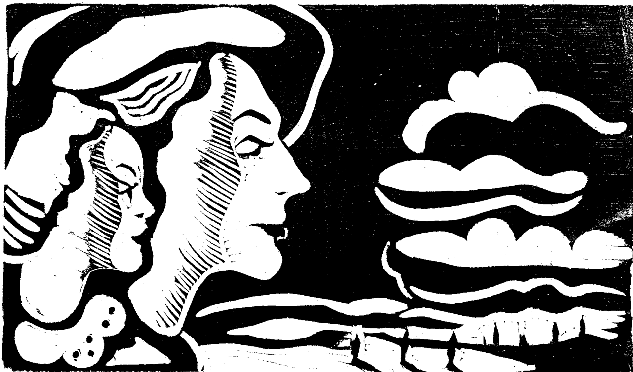
Gravură de Paul E. Erdős

S'au împlinit și cu asta vorbele cântecu- lui și legile firii, ca să ia săracul pe bogat, uritul pe frumos și leneșul pe cel vrednic, că așa vrea și așa potrivește Dumnezeu.