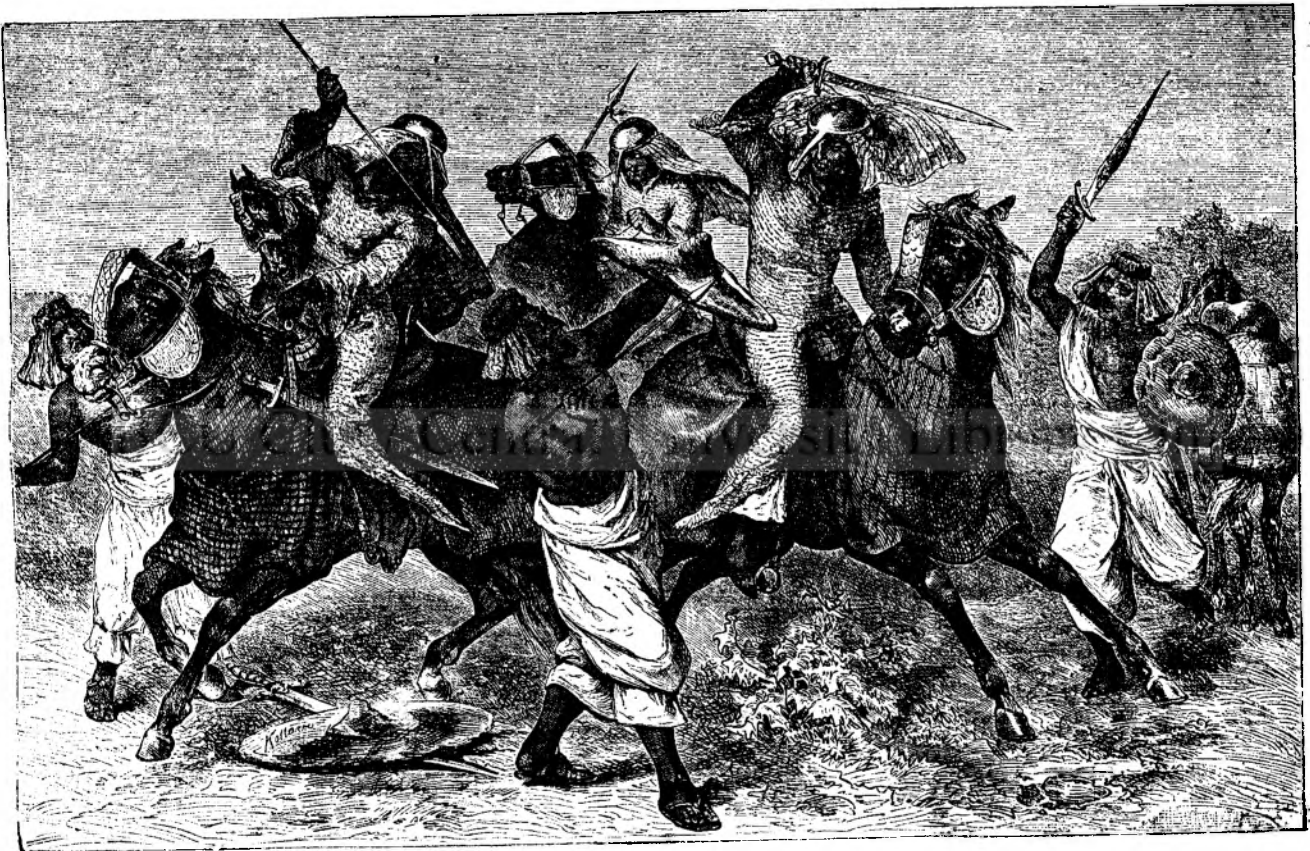
O LUPTĂ ÎN RESĂRIT.

Cele trei surori ale lui Ionel, — Catia, Sonia și Mașa, — cea mai mare era de unsprezece ani, — sedeau la masă și nu-și luau ochii dela prietenul lui Ionel. Ceapoff era de aceeași vârstă și tot așa de nalt