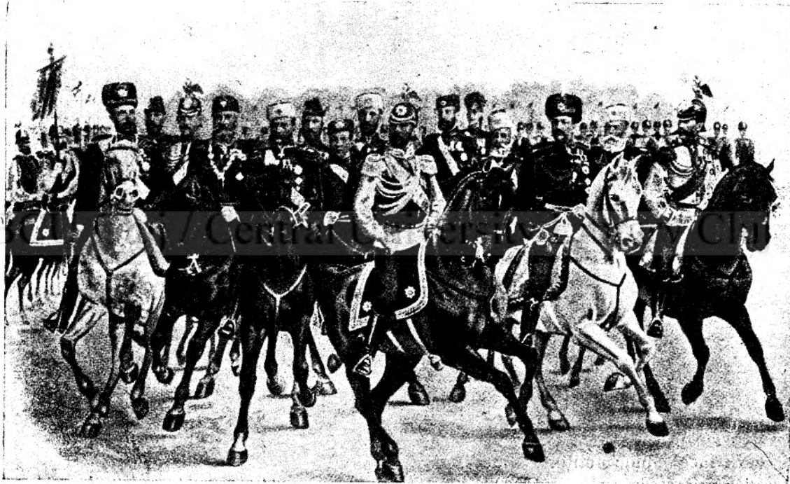
Țarul și suita lui.

Röknitz. Adineaori mi-ai declarat că ai face tot ce stă în pozibilitatea unui om, ca să schimbi existența aceasta, și iată când îți arăt această pozibilitate, te dai laș înapoi. Nu ți-e teamă că ea se va ofili în atmosfera aceasta de dugheană, unde nu e destul de conziderată nici măcar de nevestele judecătorului și a doctorului?... Apoi dacă nu știi dta, frate dragă, stai să-ți spun eu, că soția dtale este inzestrată cu cel mai bizar amestec ce se poate afla în caractere... este și bună și mândră totodată... Bagă de seamă ce poate să se desvolte din bunătatea ei, dacă va simți zilnic înfrângeri în mân-