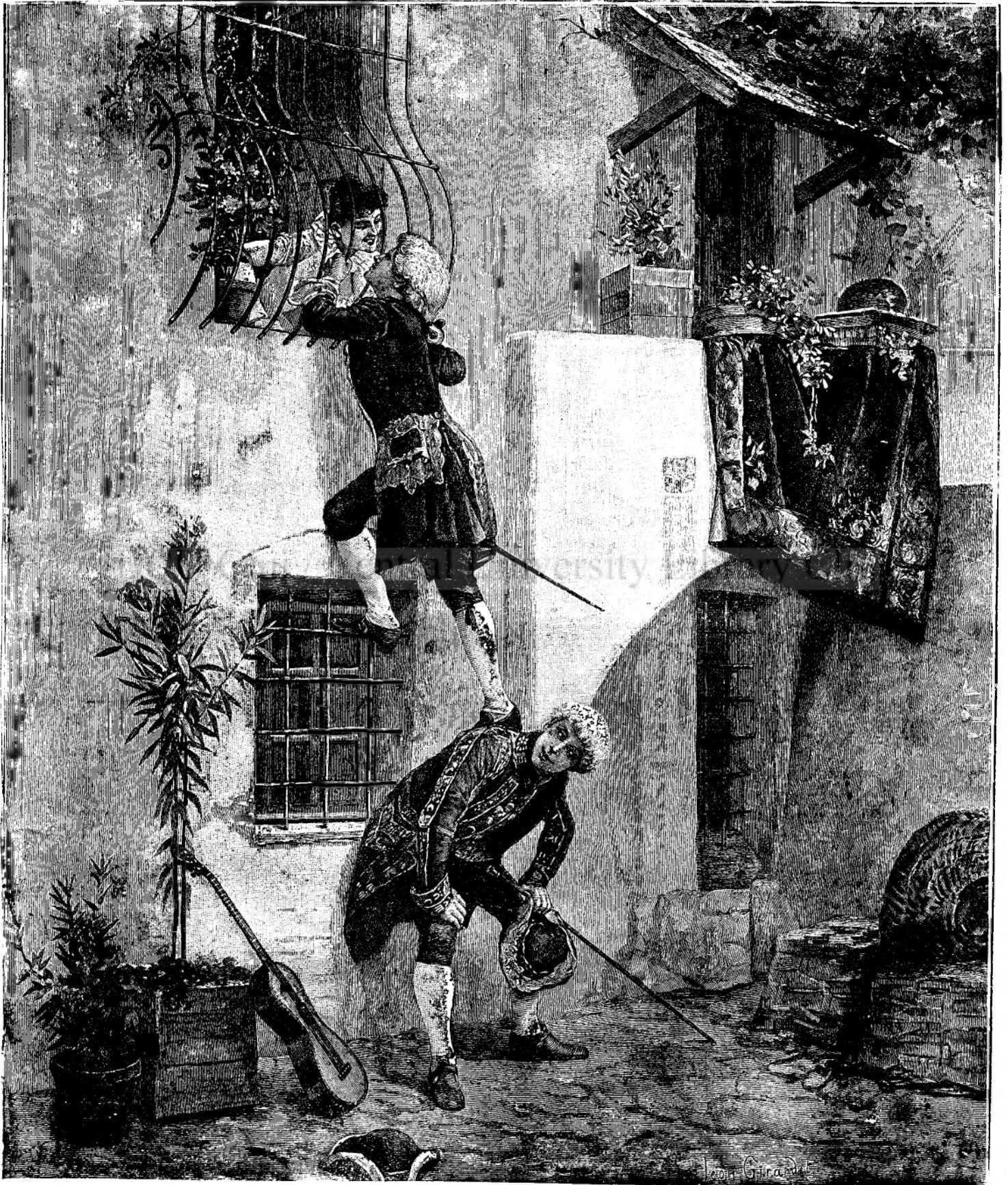
O scenă romantică.