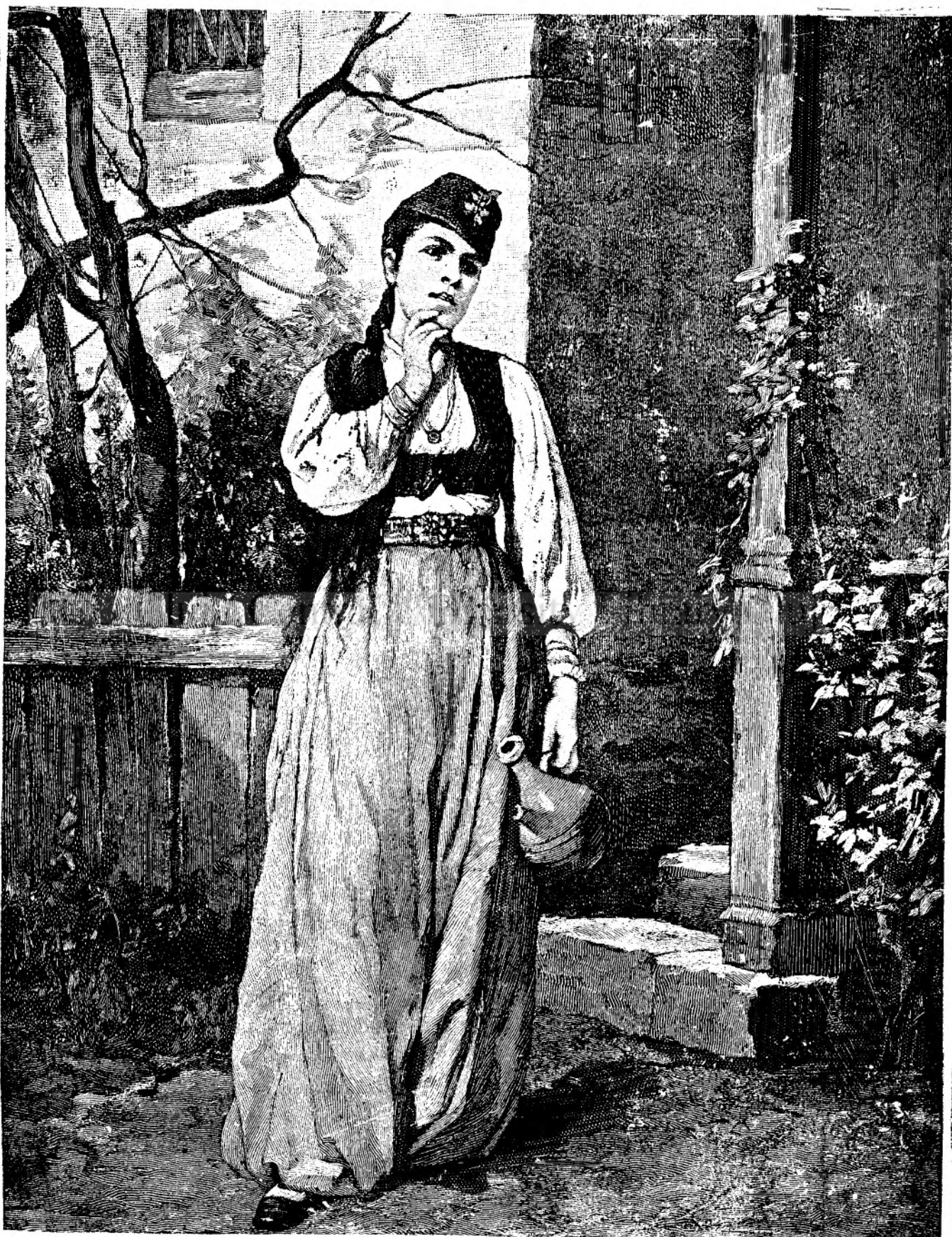
Bulgară de la Dunăre.