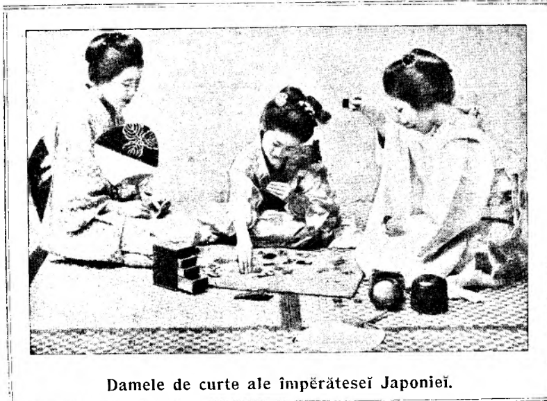
Damele de curte ale împărătesei Japoniei.