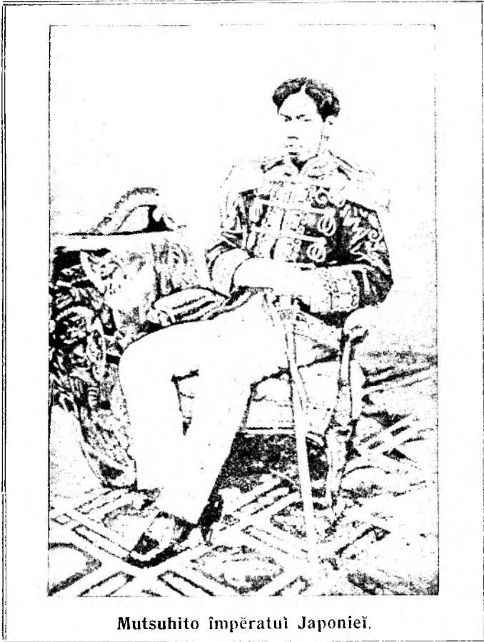
Mutsuhito împăratului Japoniei.

eū mai mult, cu atâta vorbiiu acuma despre diferite lucruri.