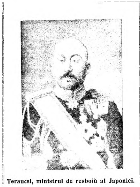
Teraucsi, ministrul de resboiū al Japoniei.