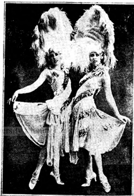
DOUĂ SURORI LONDONEZE celebre dansatoare

Mantale de ploaie 850 Lei. Trench-Coats, RAGLANE 3.500 Lei.