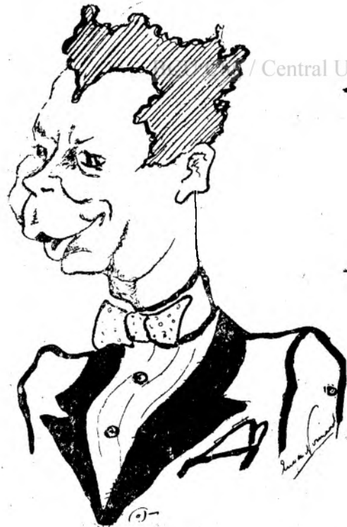
Poetul Lucian Blaga

punerii în scenă. Născocise un nou fel de a lumina scena și a provoca perspective. Desființa culisele și introducea decorul cu uși și ferestre cum le are omul în casa lui. Aducea pe scenă mobilă și rechizită adecuată situațiilor.