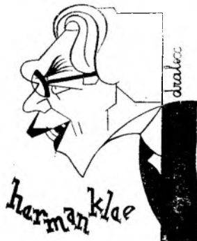
Herman Klee, maestru de cor

Nota. Numele precedate de o * desemnează pe noii angajați.