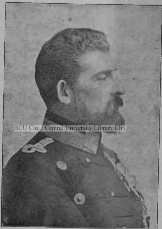
Maj. Sa Ferdinand I. Regele tuturor Românilor.