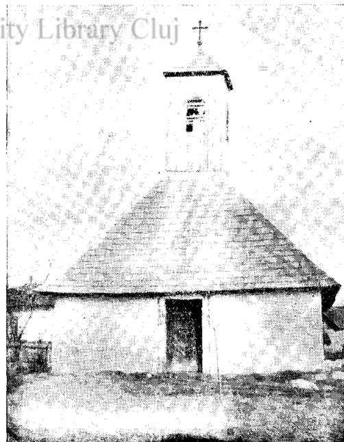
Biserica de lemn din com. Căpăt, jud. Timiş-Torontal

* Călăreți de elită. De aici numele de spăii a marilor proprietari dinainte de 1918 în Banat.