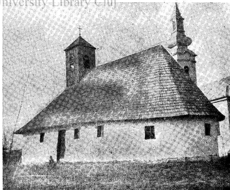
Biserica de lemn din Căpăt, construită la anul 1778. (Monument istoric.)