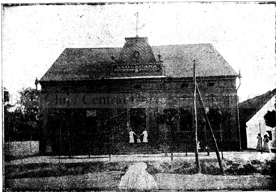
Instituțiu de credit Nădlăcana.

Din viața țarului Nicolae II. Următoarea istorie amuzantă povestește ziarul „Gaulois”: În anul 1891 sosi la Petersburg un francez, care nu mai fusese de loc în capitala imperiului rusesc. Francezul se duse seara la concertul de promenadă din pala-