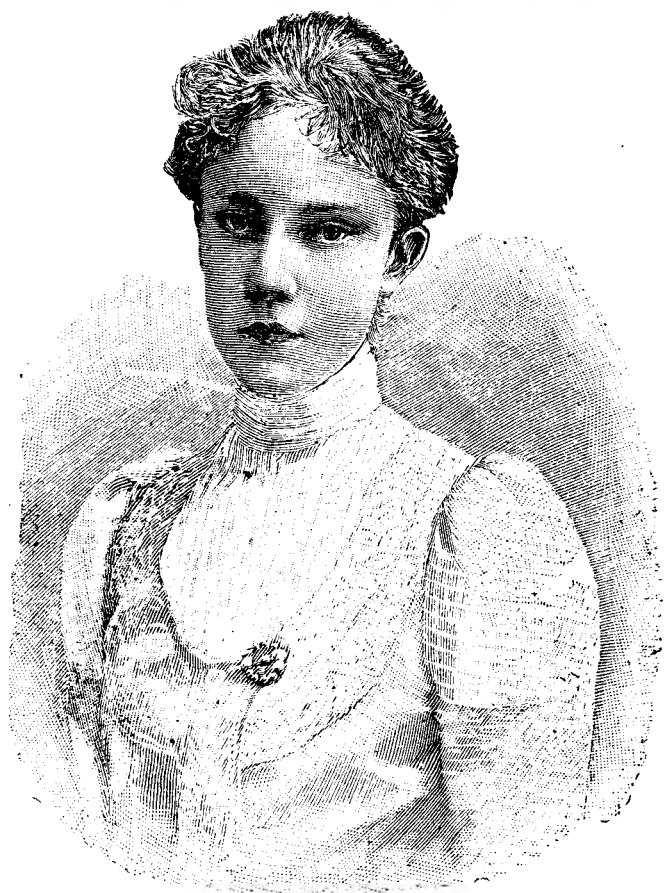
Principele Otto Windischgrätz și nevastă sa archiducesa Elisabeta.