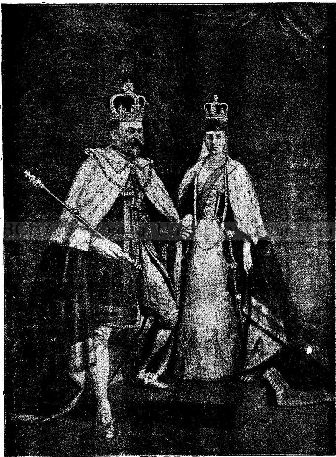
Regele și regina Angliei în costumul de încoronare.