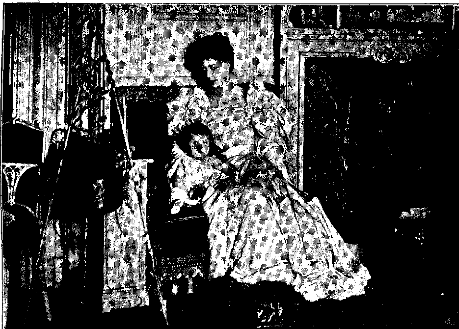
PRINCIPESA MARIA A ROMÂNIEI ȘI FIICA SA PRINCESA ELISABETA.

Astfel transformă arta lucrurilor cele mai ordinare; căci tot astfel în natură ființele lipsite cu deseversire de ceea ce lumea este obișnuită să numească frumu-