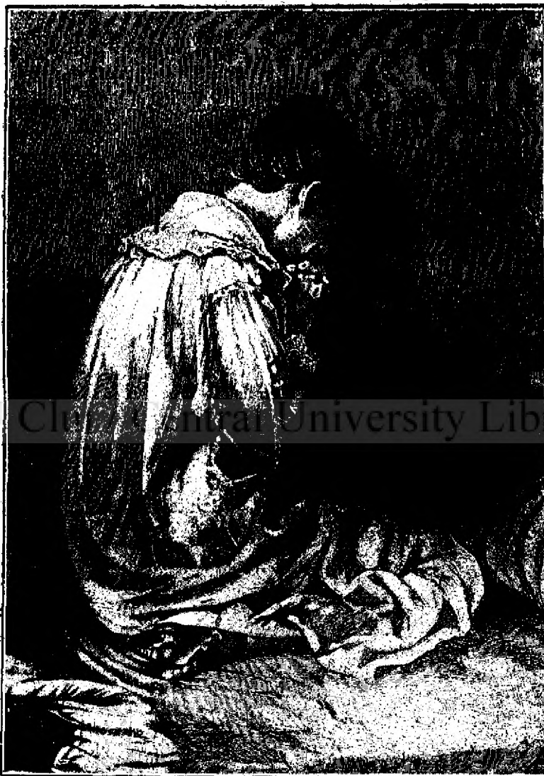
RUGĂCIUNEA DE SEARĂ.

Cel mai preferabil este temperamentul sanguin, amestecat nițel cu cel flegmatic. El ajută ca forța vitală să fie distribuită în cantitate convenabilă, prin calmul, ordinea și armonia ce face să se nască în operațiunile interne. Grație lui, se produce curagiul, moderațiunea, sângele rece, mulțumirea, cum și viața lungă și fericită.