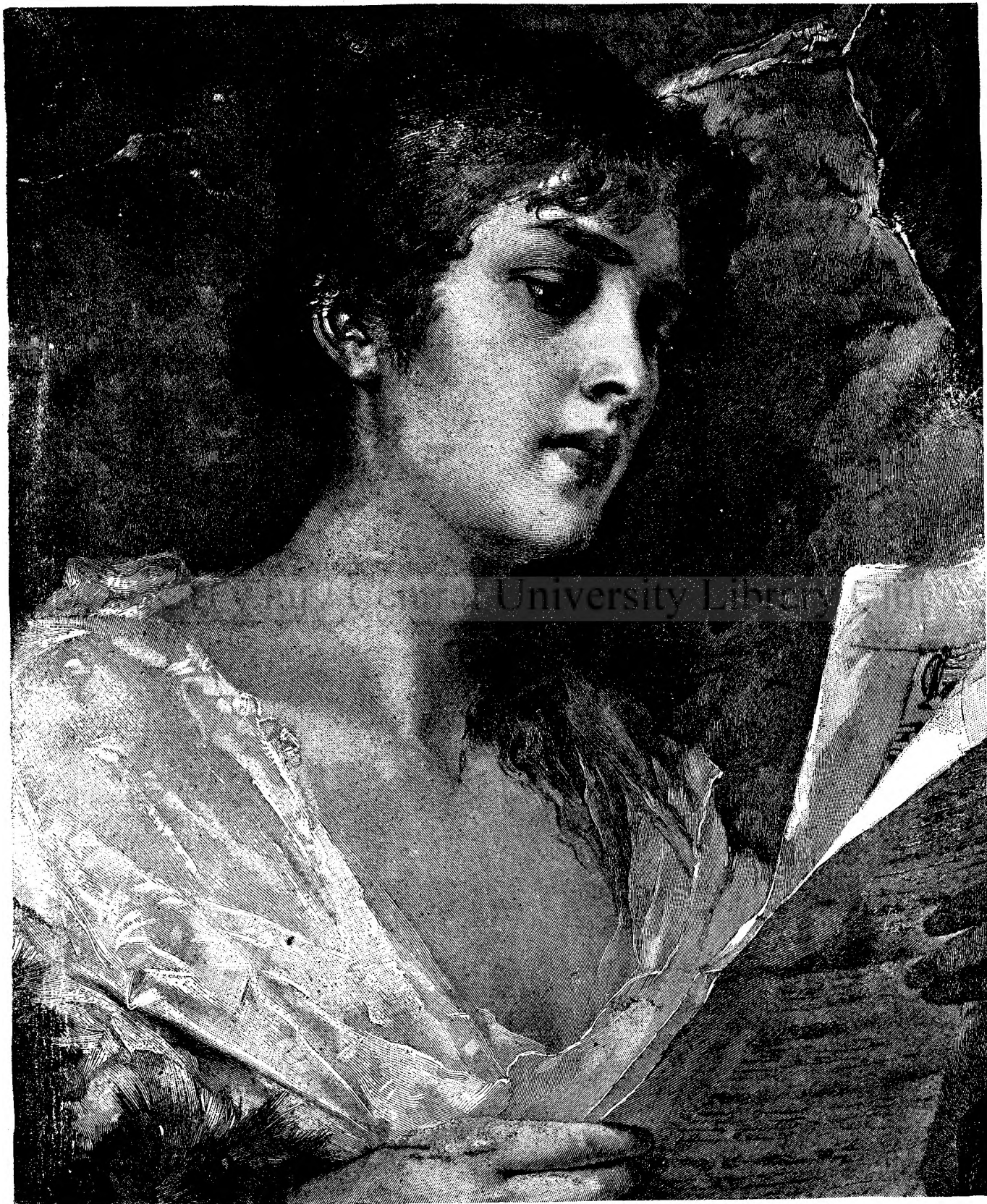
S c r i s o a r e a l u i .