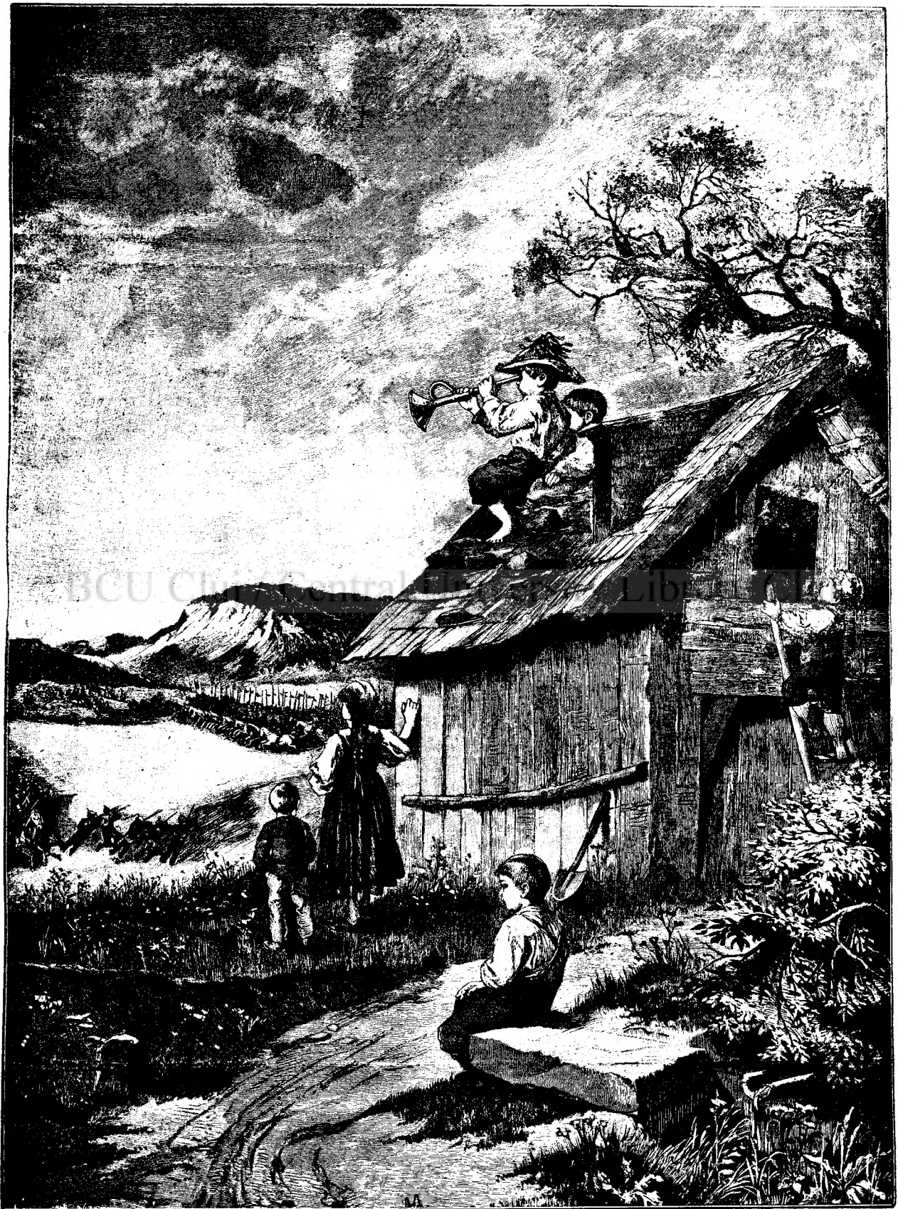
L A M A N E V R E.