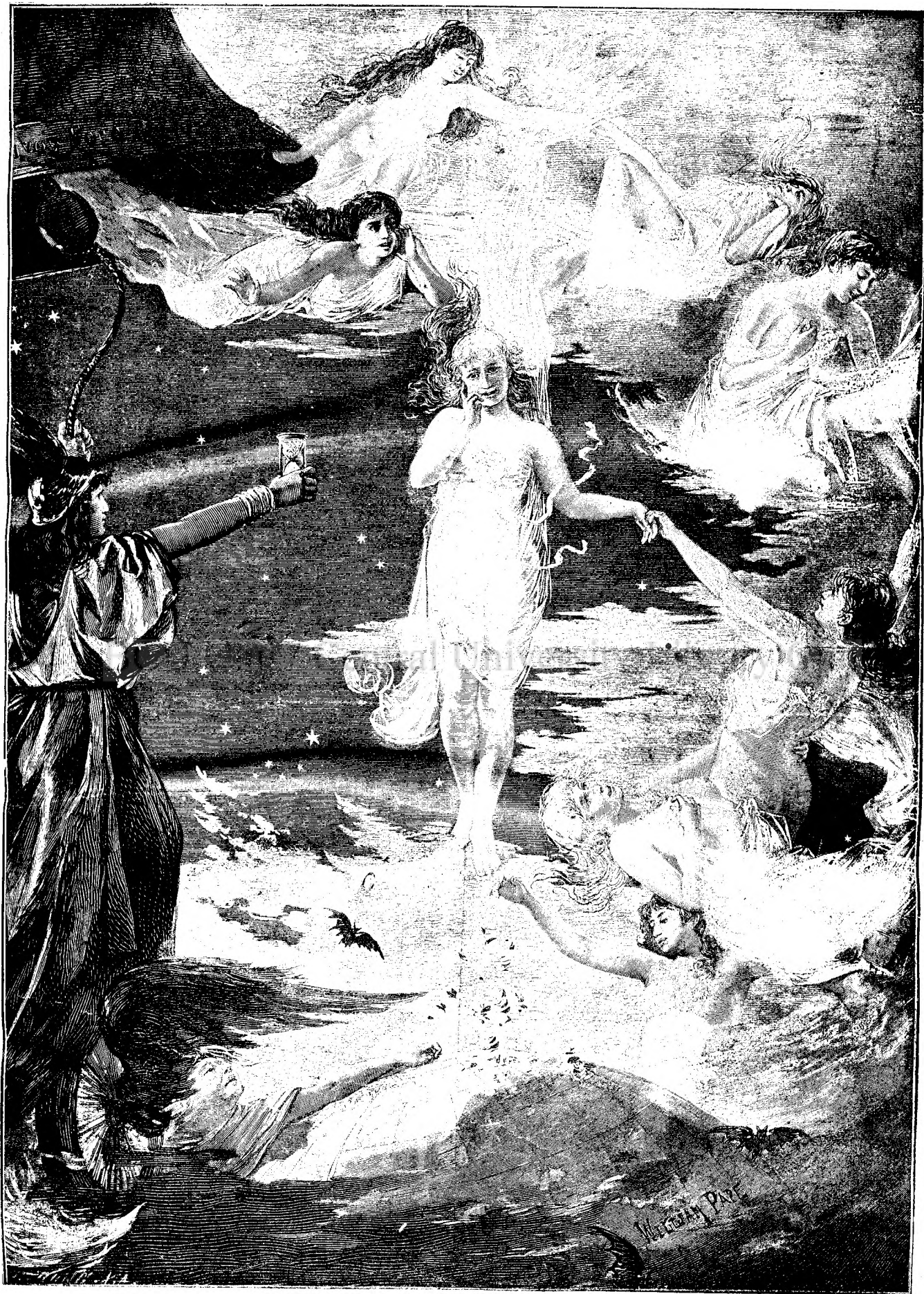
SALUTAREA ANULUI NOU.