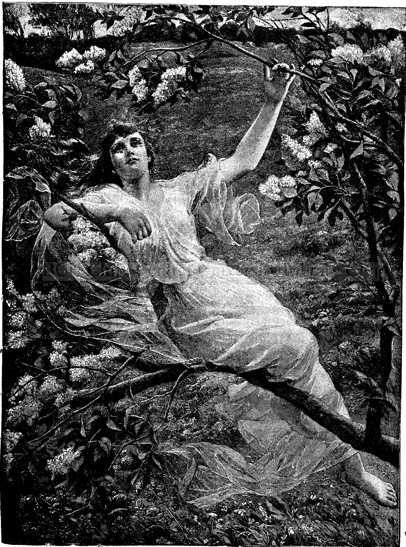
ÎN LUMEA VISURILOR.