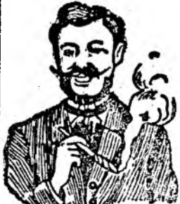
Pastilele lui Egger mă scapără iute.