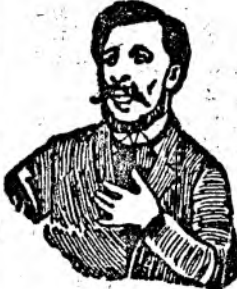
Afurisita de tusa mă înneacă