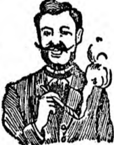
Pastilele lui Egger mă scăpară iute.