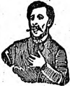
Afurisita de tusa mă înneacă.

La tusa, răgușală și întrocănare ajută sigur și repede