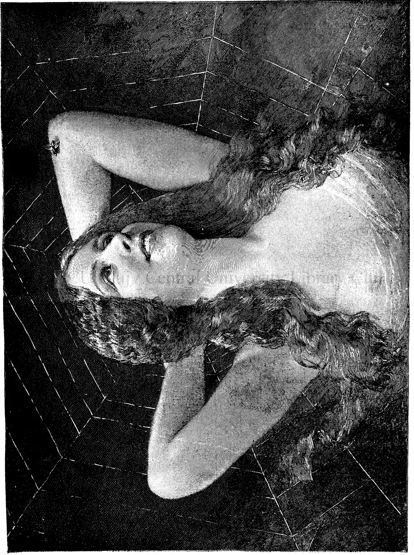
P A I N G E N U L