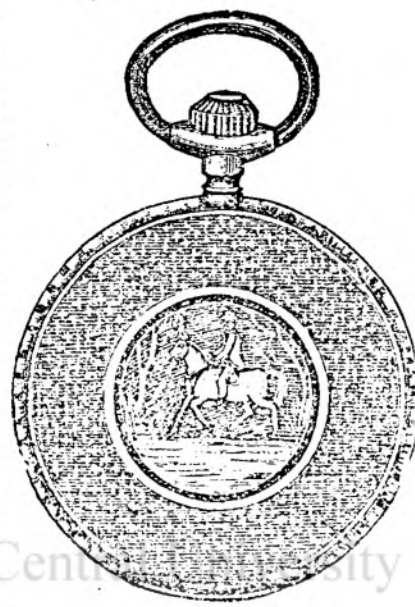
Nr. 160 F.

Reflectanți sunt recercați a se adresa la proprietarul Sigmund Freiler, fabricant în Orlat (Szebenmegye).