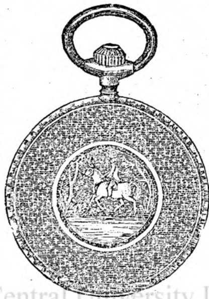
Nr. 160 F.

Lanțuri de argint 2 cor. 90 bani până la 10 cor. Șinoare pentru orologiu, 20, 30, 50 bani.