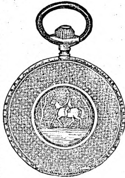
Nr. 160 F.

În casuri de urgență confecționez un rind complet de haine în timp de 24 ore. 70 6-