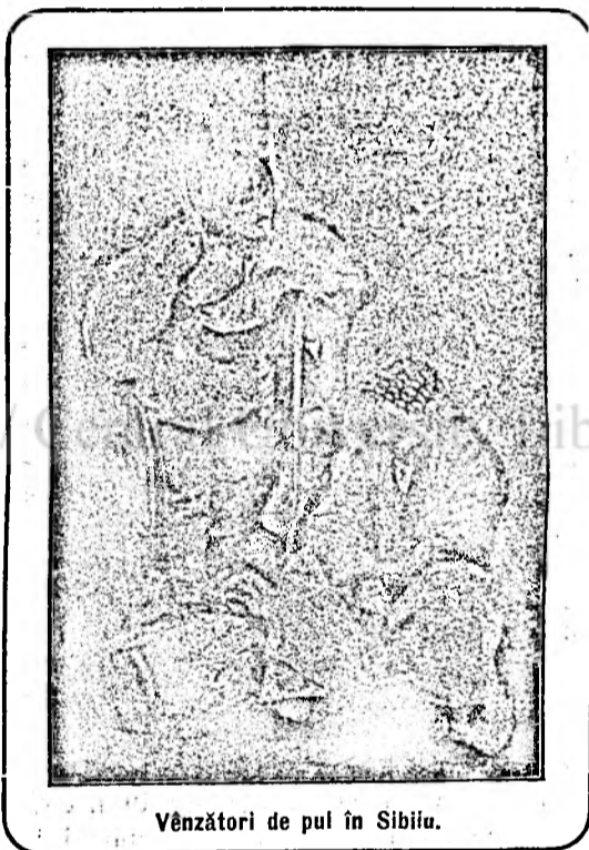
Vînzători de pul în Sibiu.

Păstrarea în pivniță este negreșit cea mai sigură și mai îndemnată, presupunînd însă că aceasta este uscată, în destul pe afundă și provăzută cu mijloace de aerisare. Avînd un castan gol pentru straturile calde, iernarea legumelor se poate face în mod foarte ușor. Castanul se provide cu un înveliș de frunze, asigurându-se în contra pîtrunderii gerului prin ferestre și coperiș. Fără acoperire în liber se țin: sălata de iarnă, sălata de câmp, spinacul de iarnă, pîtrănjeii ș. a.