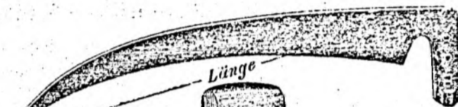
45 cr. 50 cr.