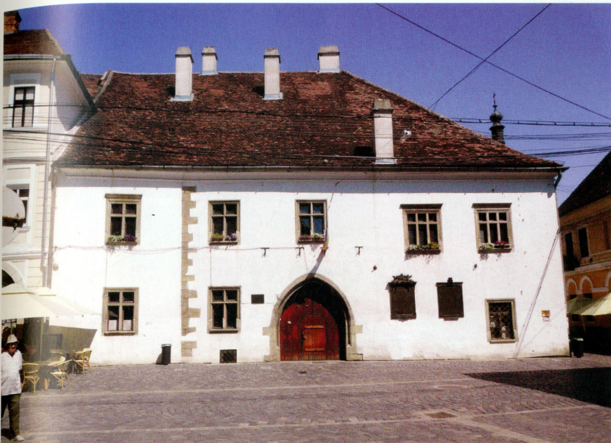
CASA din Cluj Napoca în care s-a născut Matia Corvin

se cuvin relevate: 1) pe frontispiciul său tronează o stemă falsă a Clujului, cu simboluri heraldice atipice, neaprobată vreodată de specialiști și mai ales de Comisia de Heraldică a Academiei Române; 2) numele regelui este trecut în forma populară de „Matei“, deși se știa că aceasta este, sub aspect științific, incorectă; 3) regele este caracterizat drept „român“, când, în fapt, el avea doar origine românească pe linie paternă, cea care, de altminteri, conta în epocă; corect era să se releve doar spița sa românească; 4) textul englez conține cel puțin o greșeală de ortografie (este scris according to în loc de according to ). Toate acestea pun placa respectivă într-o lumină nefavorabilă, cel puțin pentru cunoscătorii. Aceasta nu înseamnă că o inscripție în limba română – limba maternă a 80% dintre clujeni! – și într-o limbă de circulație internațională nu era necesară. Era foarte necesară, dar trebuia pusă cu oarecare precauție, după consultări cu specialiștii, care există din plin în marele oraș universitar și academic de pe Someș.