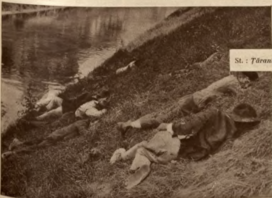
St. : Țărani veniți la București, — în căutare de lucru, — neavând adăpost, dorm pe malurile Dâmboviței.