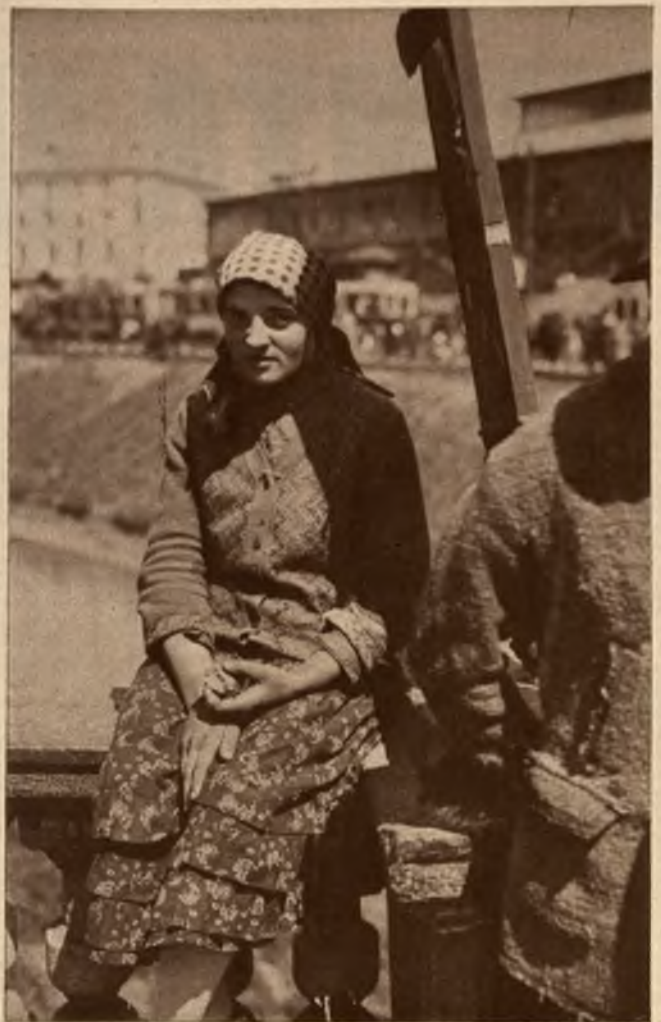
Atrasă de mirajul orașului, femeia dela țară a venit la București, să se bage servitoare”. Și în așteptare, pe cheiul Dimboviței rabdă de foame.

— Măi băete ești om singur. N'ai nici o grije; dacă vrei să rămăi pe aici fă-ți și tu o cunoștință... Femeii sunt la tot pasul, cât părul din cap. Li dai și tu la început un mic dar, ca să-i iei ochii și-ai să vezi că n'ai să mai scapi de dragostea ei. După ce-ți faci interesul cine te împiedică să nu-ți găsești mai târziu alta, cu un rost mai bun.