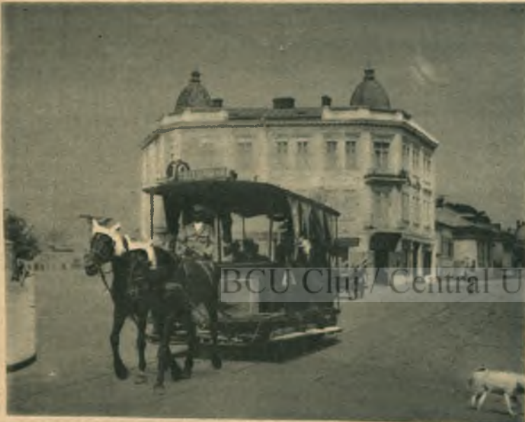
Tramwayul cu cai, un anachronism care a dispărut

Bucureștenii au învățat să cîrcule occidental. La întretăerile principale, nu se traversează strada, decât la semnalul agentului de circulație