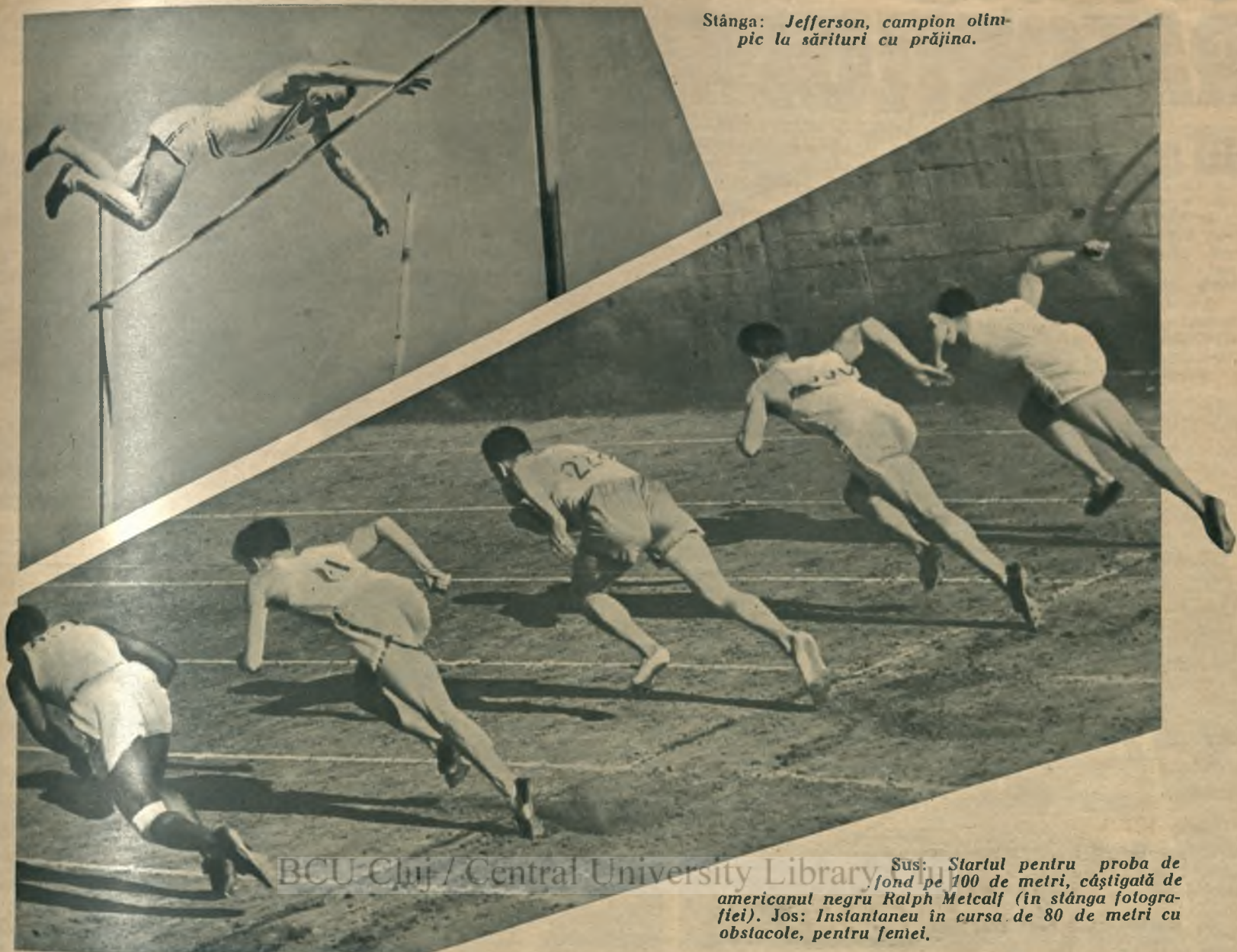
Sus: Startul pentru proba de fond pe 100 de metri, câștigată de americanul negru Ralph Metcalf (în stânga fotografiei). Jos: Instanțianeu în cursa de 80 de metri cu obstacole, pentru femei.