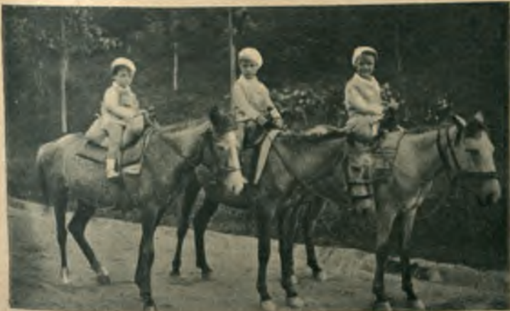
Fotografia noastră reprezintă un grup de trei copilași, călări pe cai de munte, făcând o excursiune în împrejurările stației Olănești.

La regimentul 9 Călărași din Constanța, am avut de înregistrat de curând o condamnare asemănătoare: doi soldați au furat o pereche de cisme și au fost prinși. Camarazii i-au condamnat să fie legați la stâlpul înșamei și trecând apoi cu cismele legate în spate au trecut prin fața întregului regiment, aliniat de două rânduri. Ostașii i-au scuipat acoperindu-i cu întregul lor oprobriu emanările glandelor lor salivare. A fost o pedeapsă exemplară care va tăia altora pofta de furturi.