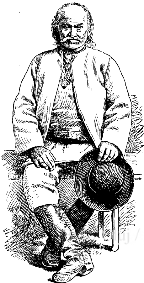
Port țărănesc din Vinerea.

Aceste adevăruri atât de strălucitoare, cunoscute și admise de cei mai mari filosofi ai păgânismului și de școlile lor, se confirmă în modul cel mai evident prin istoria antică și modernă. Până când la un popor a înflorit religiunea, au înflorit și cele mai alese virtuți civile, drepturile cetățenilor au fost respectate, cei răi au fost pedepsiți, pacea s'a conservat în foculariul domestic și în con-