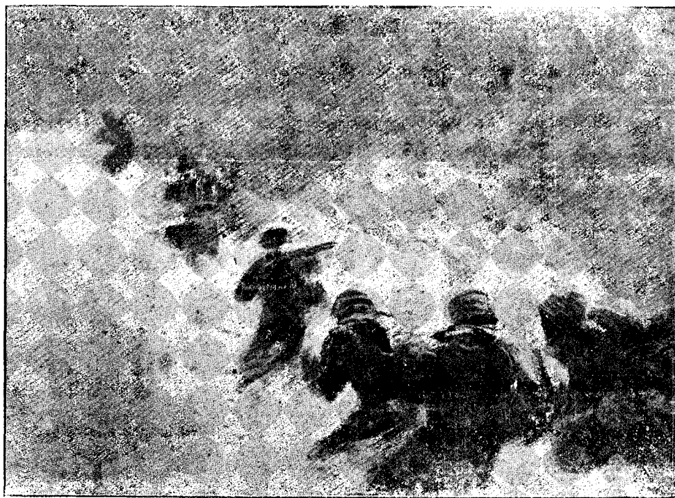
Lupta contra sloilor de gheață.

„Dacă drepturile s'ar constitui prin plebiscitul poporului, prin decretul principilor, prin sentințele judecătorilor, atunci furturile, adulteriele, testamentele falsē ar fi tot atâtea drepturi, supunēnd că ar fi sancționate de sufragiile judecătorilor sau de plebiscitele mulțimeii. Așadar dacă sentințele și poruncile nebunilor au atâtea putere de a rēsturna însăși natura lucrurilor, pentru-ce nu sancționēză ca acele lucruri cari sunt rele și periculōsē, să se rețina de bune și salutari? Sau pentru-că purtând legea se facă drept aceea ce e nedrept, nu va putea să