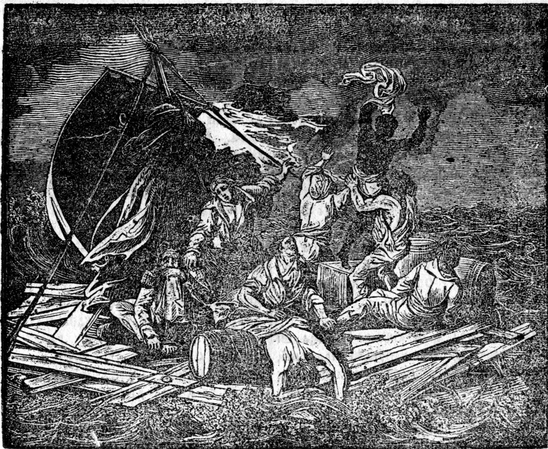
Спарцеръ Корзвїи Медвзї.

ПОРТЪА ЯФРІЧЕСКЪ ИРЪШ АНАПОІ. АШАДАРЪ А 17. ІВНІЕ ДІН ЯНВЛ 1816 САЗ ДЪС О ВЪ- ПЕДІЦІЕ СЪПТ ЧЪ МАІ МАРЕ ПОРЪНІКЪ А КА- ПІТАНЪАВІ ФРЕГАТТЕЛОР ДЕ ХАЗМЕРАІС ДЕ- ЛА ІНСОЛА ВІЪ ПРЕ АПЪ. КОРЗВІІЛЕ ЕРА КЪ