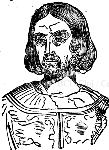
Рѣдолф де вѣрт.

Ѣнѣл дѣн трѣншіі, ѣн вѣтѣз, ѣн тѣнѣр фрѣмос; де старе нобѣлѣ ші дѣналѣ, ші богѣт фѣартѣ іѣк пре дѣлаїда, ші оѣс черѣт. Графѣл дѣнат ѣс волѣт, ші волѣнд ші Гора, с'ѣс дѣоцѣт ѣ кѣсѣторіѣ. дѣчѣла ѣра рѣдолф де вѣрт, ші фѣ вѣрѣбатѣлѣ ѣї.