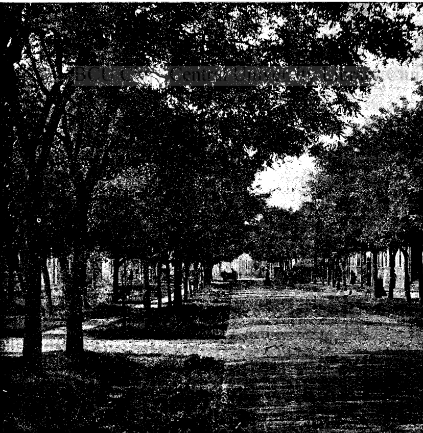
Japán akáccal beültetett utca

„A mézelő növények közül ujabban nagyon felkapták a japán akácot, vagy szoforát. Sajnos azonban a mi hideg ég-