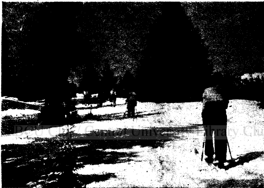
Útban, az Öreghavas felé.

levegőben. A terrazon keztyűk, sítók és fókák költői rendetlensége fogad. Mindenki magyaráz, mindenki ismerkedik. Milyen könnyen megy ez itt, a fehér csend s a béke patyolat-tisztaságú birodalmában. Csakhamar ott suhanunk a pompás lejtőkön. Sportoktatónk maga köré gyűjti a még zöldfülű „csibéket“ s csakhamar be is vezeti őket a támasztott ívelés rejtelmeibe. A haladók már merész tempóikkal kerülgetik a fenyőcsonkokat, a „természetjárók agytrösztje“ pedig térkép felett főzi ki a holnapi „nagy számot“.