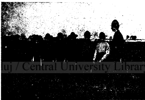
Cserkész őr „Vigyázó” állásban

A második mozzanat annak folytonos szemmel tartása, hogy ezt az intézményt a mi sajátos viszonyainkhoz, szükségleteinkhez alkalmazva kell és lehet csak átvennünk. S ehez kapcsolódik mindjárt a harmadik, mely a mi szempontunkból, de eredetiség tekintetében is legfontosabb, hogy a mi cserkészeink „cserkész-túristák” legyenek.