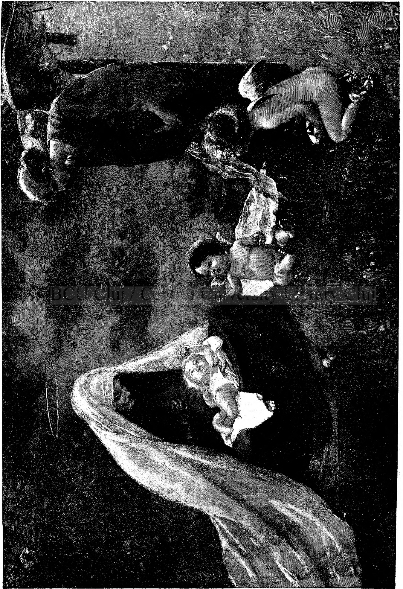
M A D O N N A Ş I I S U S