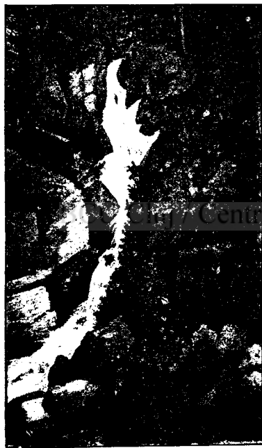
Alsó-száraz-tömösi vízesés. »Zuhogó.«

Ezen felül szakadatlan láncolata következik a gyönyörű vízeséseknek, melyeknek alakjai a vízbőség szerint, vagy egyes görkövek ide-oda vándorlása következtében néha változnak ugyan, de mindig szépek maradnak. Kettejét rajzban is bemutatják a feljebb fekvő Maladinkő rajzával együtt, a meddig e vízesésekben gazdag út tart, melynek leírását folyóiratunk m. évi folyama 387—388. lapján közöltük. A Maladinkő — vagy