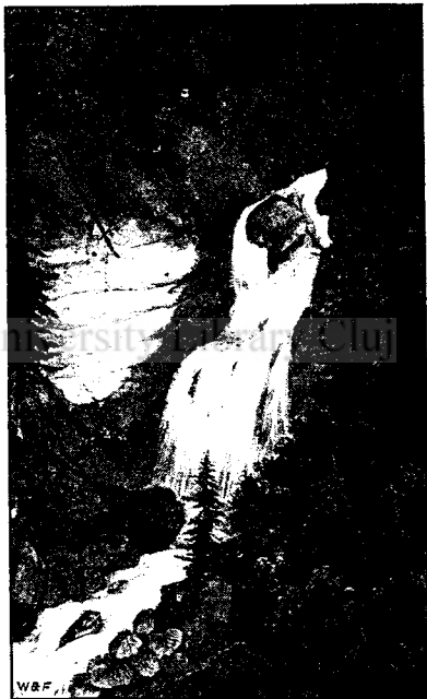
Alsó-száraz-tömösi vízesés. »Fátyol.«

más néven hasadtkő — a patak több ezredéves munkája által át van szelve, s belsejében szintén szép vízesések kötik le figyel münket. A szikla-repedés egy oldal-odujában üveg-palaczk van elrejtve; az szolgál itt a látogatók könyvéül. A látogatók ugyanis névjegyeiket, vagy papírra írt névsoraikat az üvegbe dugják, azután a palaczkot ismét visszahelyezik előbbi helyére. Midőn én ezelőtt 10 évvel e szikla-repedést meglátogattam, a palaczkban még nagyon kevés nevet találtam. Remélhető azonban, hogy az E. K. E. tagjai buzgólkodásának sikerülni fog e szép természeti ritkaságokat hozzáférhetőbbé és a látogatók által keresettebbé tenni.