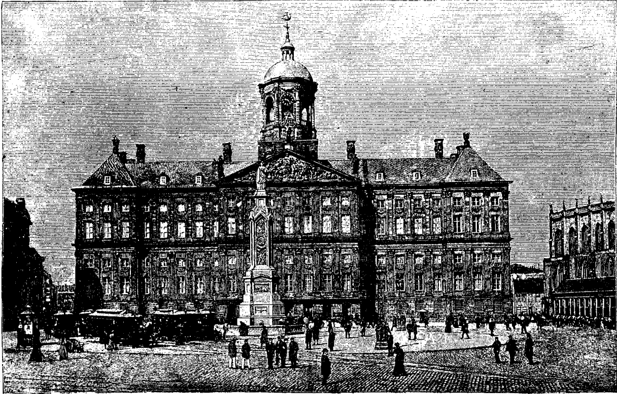
Palatul regal în Amsterdam.

BCU Cluj / Central University Library Cluj