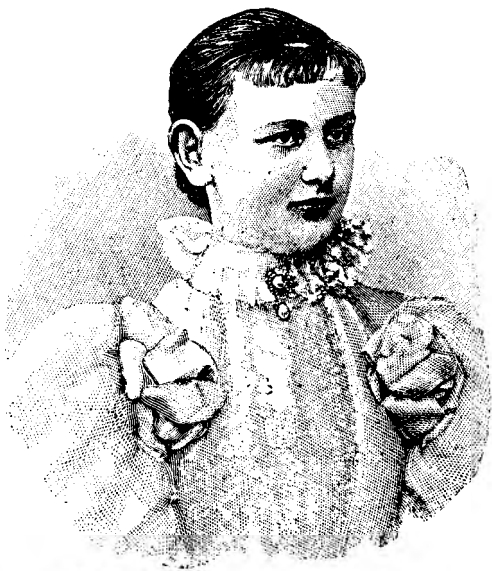
VILHELMINA REGINA HOLANDIEI.

Pulcinel ar fi fost mulțumit să se uite cu amîndouă fețele, ca să se bucure îndoit de toate aceste frumuseți, mai cu samă de o gingașă păstorită de lemn, cu rochița rotundă, cu pălăria ro-