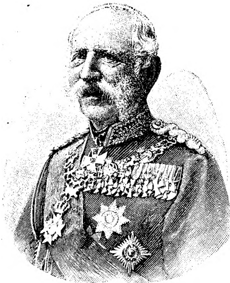
ALBERT REGELE SAXONIEI.

— Pe ăsta ți-l lăsăm ție, greule; mai fă din el