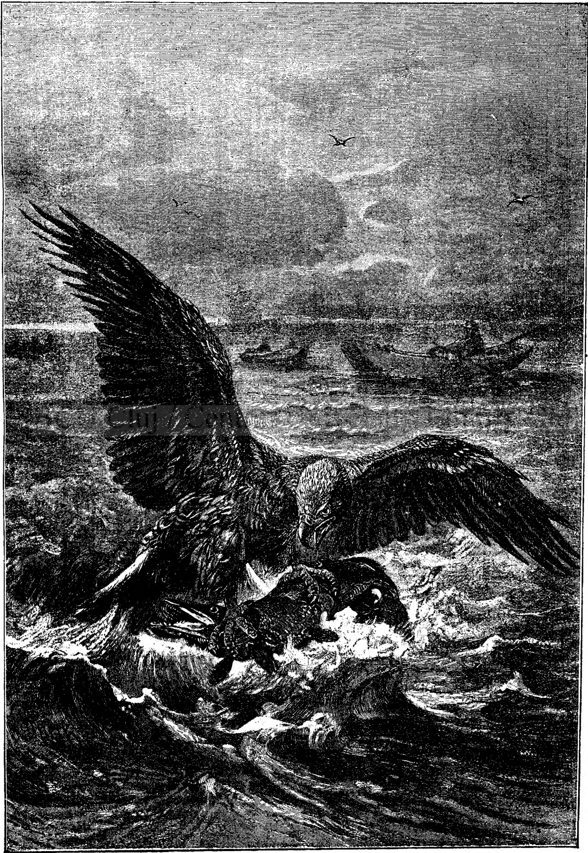
H O T D E M A R E .