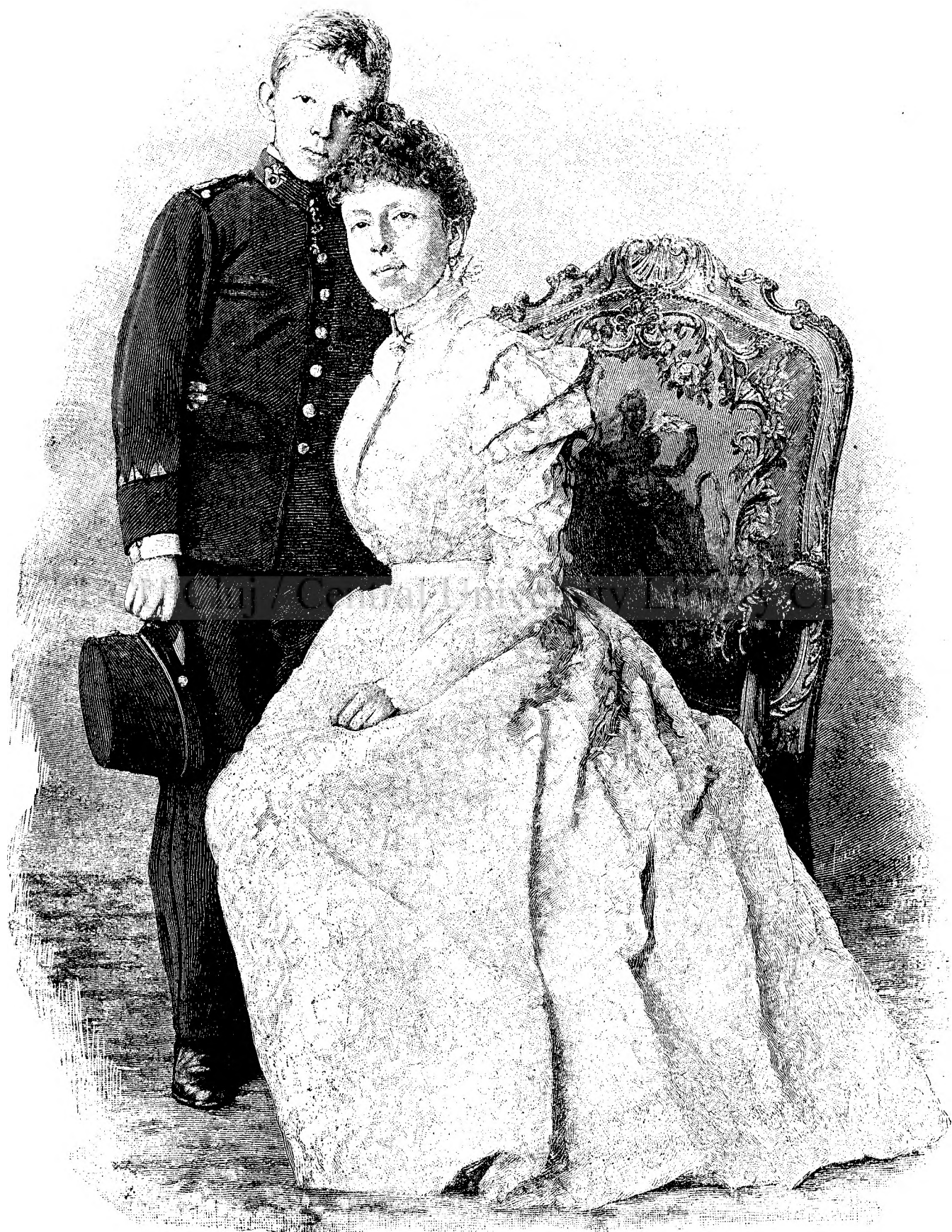
REGINA MARIA CHRISTINA, REGENTA SPANIEI ȘI FIUL EI ALFONZ XIII.