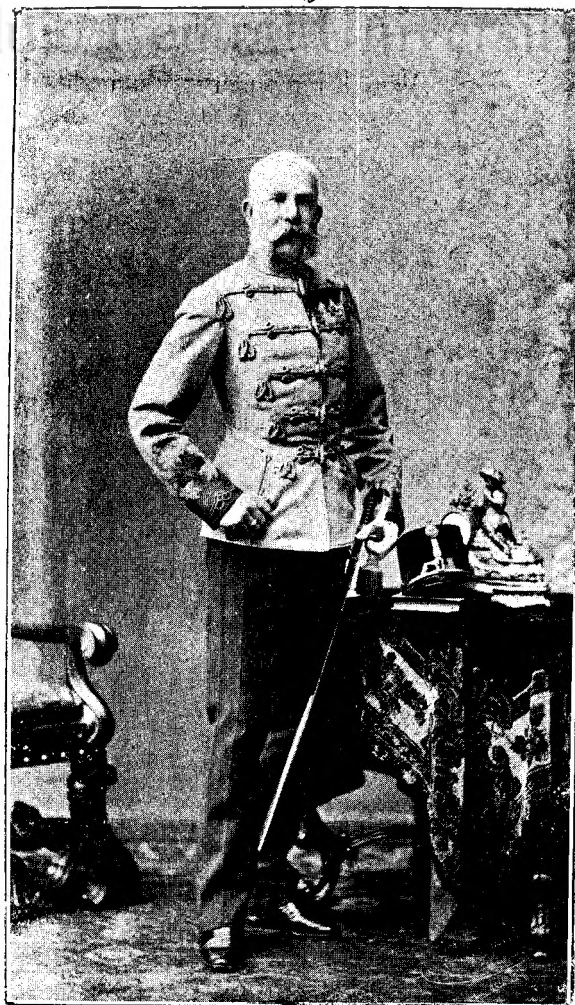
Impēratul și regele Francisc Iosif I