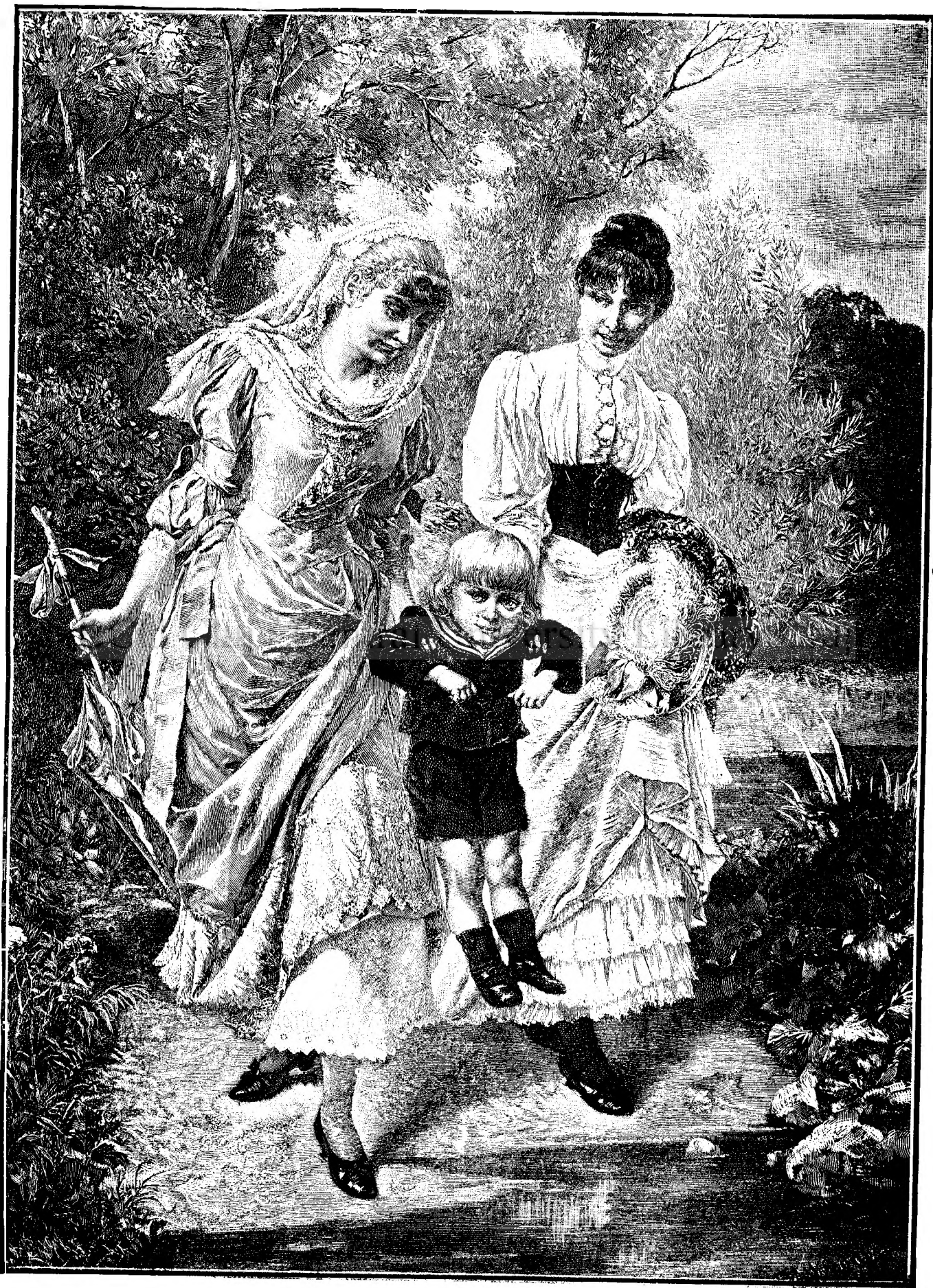
ȘTELPUL FAMILIEI. (După tabloul lui F. Wagner.)