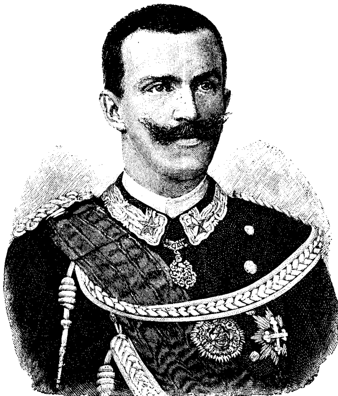
VICTOR EMANUIL, PRINȚUL MOȘTENITOR AL ITALIEI.

și săriau pe când fetele, pe care le țineau de mâni, jucau cât se pôte de frumos și de liniștit, par că alunecau peste iérbă, fără ca să-și mișce piciorule. Și cămășile și fustele lor erau bogat cusute cu roșu și negru și sclipiau de fluturi aurii. Códcele le erau impletite cu flori, și nevestele care erau imbroditate cu marama lungi subțiri, aveau cel puțin o garófă la ureche. Femeile române sânt fôrte indemânatică la cusut și la țesut, și horele lor sânt o frumusețe rară. Uneori se aușiau strigătele jucătorilor cari duceau hora, și cărora ceialalți le respundeau, ori țiganul își cântă viorei plimbându-se prin mijlocul horii, par că urmă și el jocul, ca să-l întărite mai mult. Cântăreții erau neobosiți, și când isprăviau cu hora, începeau chindia, bréul, ca la bréza, sultănica și cum le mai dice la tóte jocurile lor frumoșe. Jucătorii infierbântați se duceau și veniau de la puț ca să-și mai ude gura, și din pridvorul unei case pe care erau atârnavate coróne, priviau Domnul și Dómna cu gazda lor. În amestecătura aceea de tóte culorile, Dómei nu perise încă din ochi intristarea adâncă ce o cuprinsese când văduse oca.