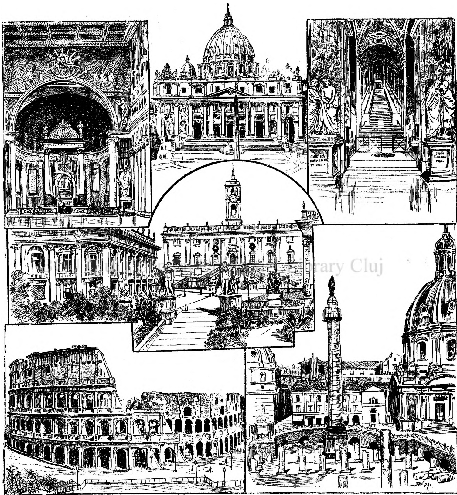
V E D E R I D I N R O M A .