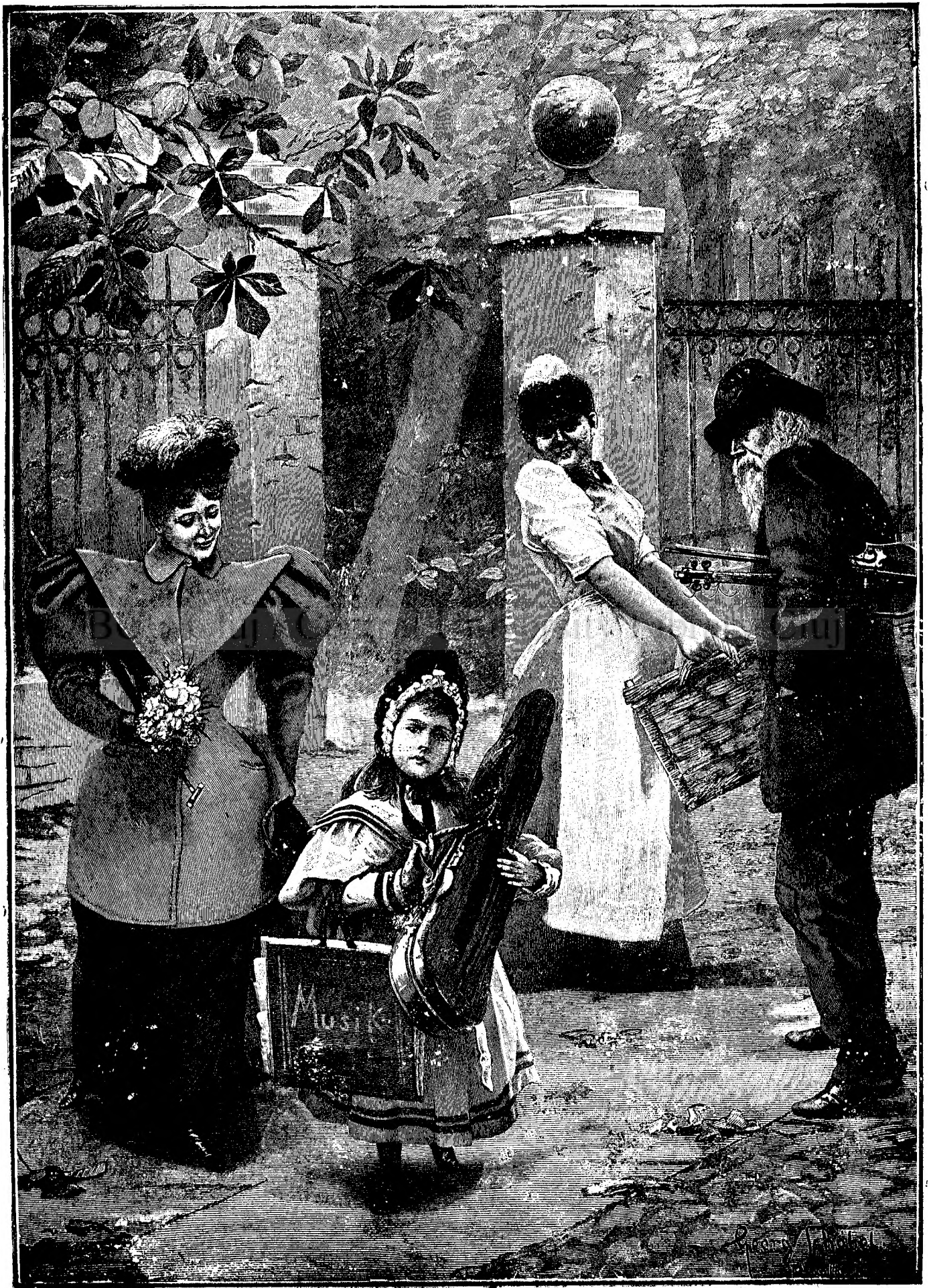
MICA ARTISTĂ. (După tabloul lui George Schöbel.)