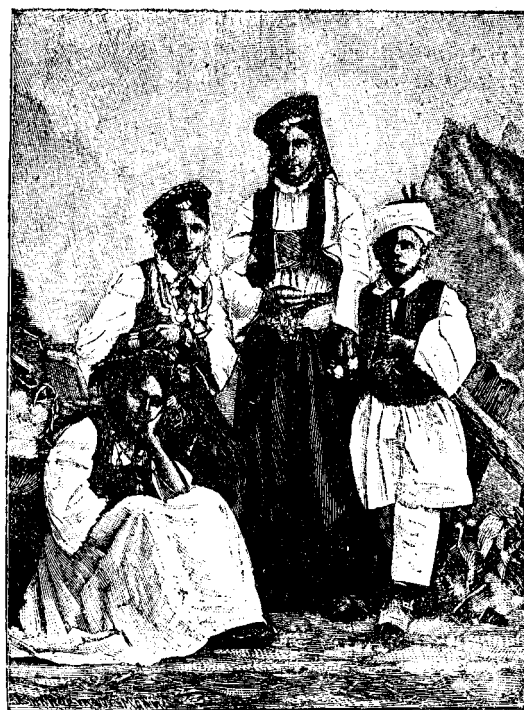
O FAMILIE DIN BOSNIA.