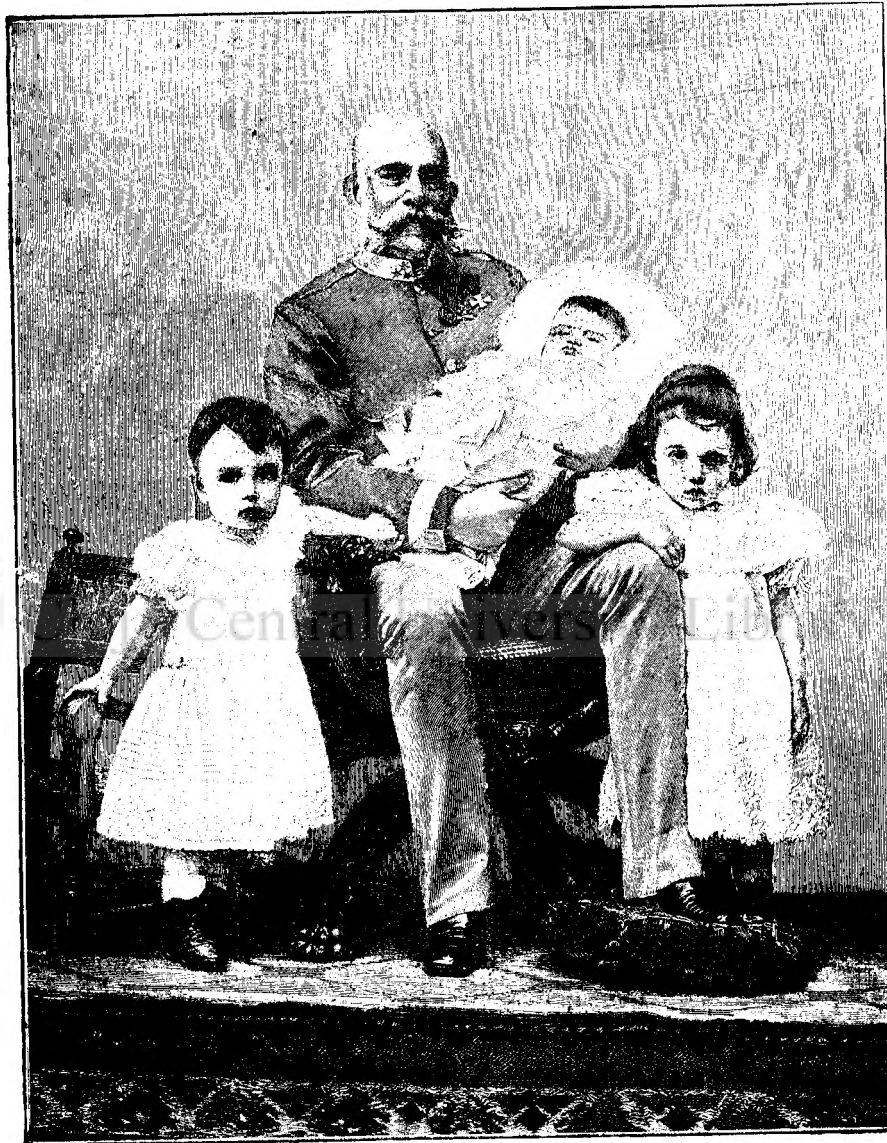
IMPÈRATUL ŞI REGELE FRANCISC IOSIF ŞI NEPÓTELE SALE.

TRIFOIU. Nu riscăm nimic, căci ne abţinem: