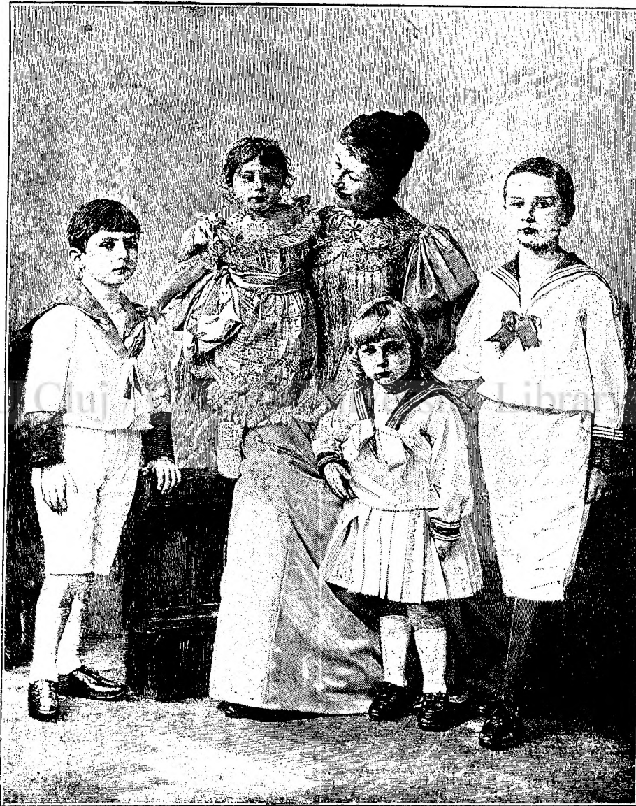
IMPÉRĂTESA GERMANIEI CU COPIII SEI CEI MAI TINERI.

DUMITRACHE. Apoi decă e vorba p'asă, lasă-l pe mâna mea pe onorabilu, c'o să-ți placă cum am